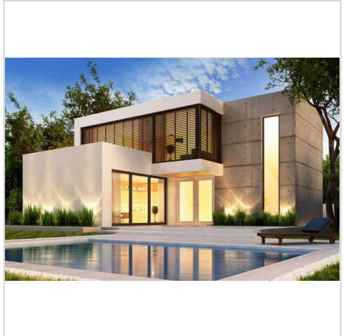
Mögliche Realisierung des Grun